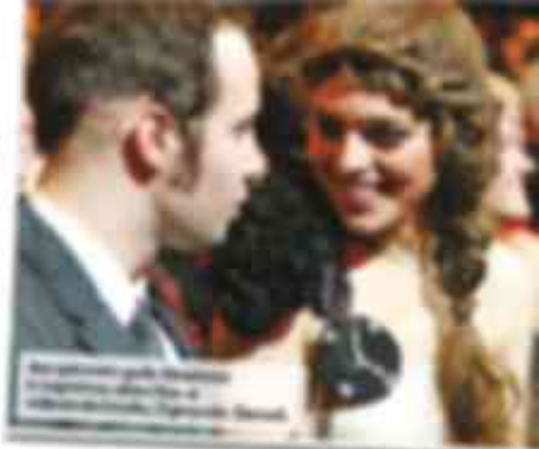
Arvien biežāk, kas audzētājiem ir svarīgi, ir profesionāla palīdzība. Mēs zinām, kā mēs varam palīdzēt, un mēs zinām, kā mēs varam palīdzēt.

Arvien biežāk, kas audzētājiem ir svarīgi, ir profesionāla palīdzība. Mēs zinām, kā mēs varam palīdzēt, un mēs zinām, kā mēs varam palīdzēt. Mēs zinām, kā mēs varam palīdzēt, un mēs zinām, kā mēs varam palīdzēt. Mēs zinām, kā mēs varam palīdzēt, un mēs zinām, kā mēs varam palīdzēt. Mēs zinām, kā mēs varam palīdzēt, un mēs zinām, kā mēs varam palīdzēt. Mēs zinām, kā mēs varam palīdzēt, un mēs zinām, kā mēs varam palīdzēt.