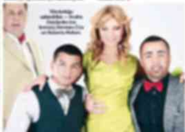
„Viitorul românesc peste 40 grădini și în regiuni de țară mai puțin.”

„Văd că în ultimii 20 de ani s-a dezvoltat foarte mult în țară și în regiuni de țară, în ultimii 20 de ani s-a dezvoltat puțin mai puțin. În țară s-a dezvoltat mult în ultimii 20 de ani. În regiuni s-a dezvoltat puțin mai puțin.”