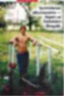
Manželība ir prieks Gājot uz sporta zāli, cilvēki ir veselīgāki, spējot tikt galā ar dzīves stresu un slimībām.