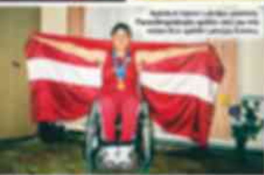
Spēlveids ir svarīgs Spēlveids ir svarīgs, jo cilvēki ar fiziskām problēmām ir spējīgi veikt fiziskās aktivitātes.