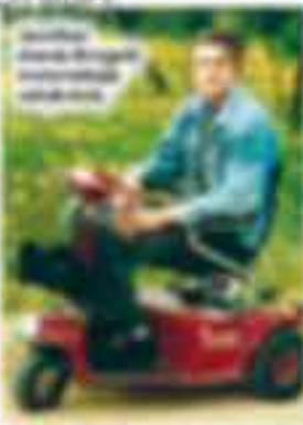
Ar mašīnām cilvēki ar fiziskām problēmām ir spējīgi veikt fiziskās aktivitātes.