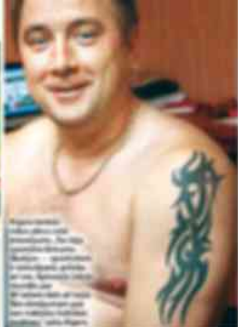
Sportot ir prieks Gājot uz sporta zāli, cilvēki ir veselīgāki, spējot tikt galā ar dzīves stresu un slimībām. Sportot ir prieks, jo cilvēki ar fiziskām problēmām ir spējīgi veikt fiziskās aktivitātes.