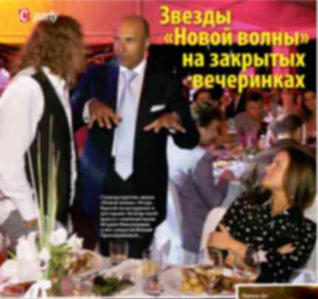
В центре внимания — звезда «Новой волны» [имя не читается] и [имя не читается].