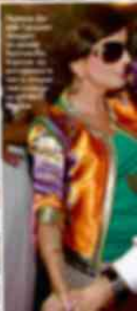
В центре внимания — звезда «Новой волны» [имя не читается].