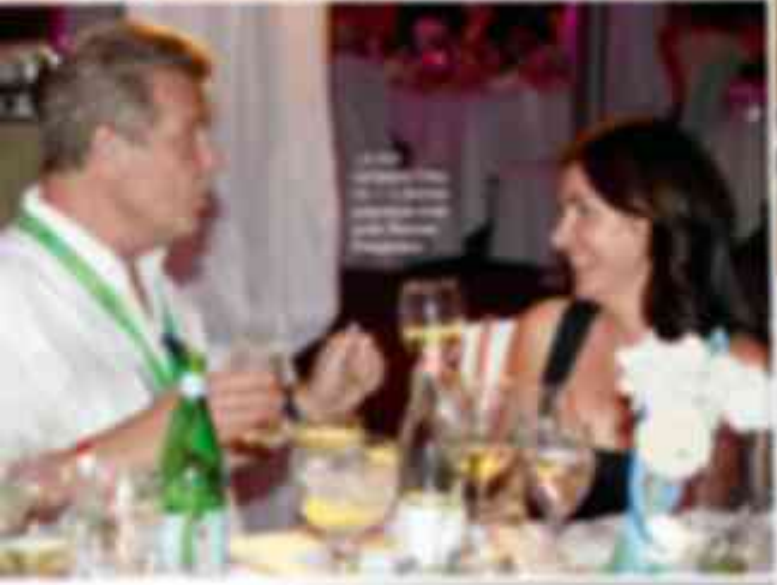
В центре внимания — звезда «Новой волны» [имя не читается] и [имя не читается].