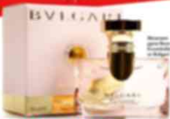
Возможные подарки в Bvlgari

В связи с 5-летием журнала «Юность» мы предлагаем вам принять участие в розыгрыше праздничных подарков. В призовой фонд включены косметика Dior, Flon и Bvlgari, а также подарочные карты на 50 евро в парикмахерскую и ресторан.