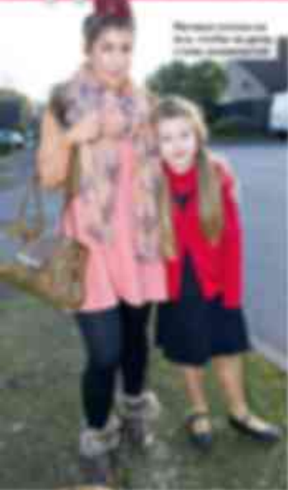
Младшая дочь звезды «Секса в большом городе»