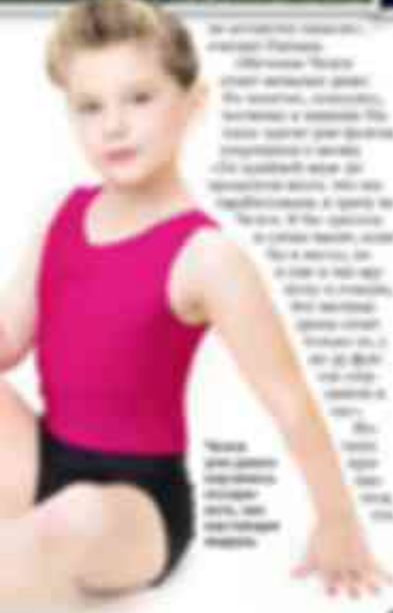
Дочь звезды «Секса в большом городе»

В интервью с журналом «Секс» звезда «Секса в большом городе» рассказала, что ее дочери очень любят наряжаться. Она сказала, что ее дочери очень любят наряжаться. Она сказала, что ее дочери очень любят наряжаться. Она сказала, что ее дочери очень любят наряжаться.