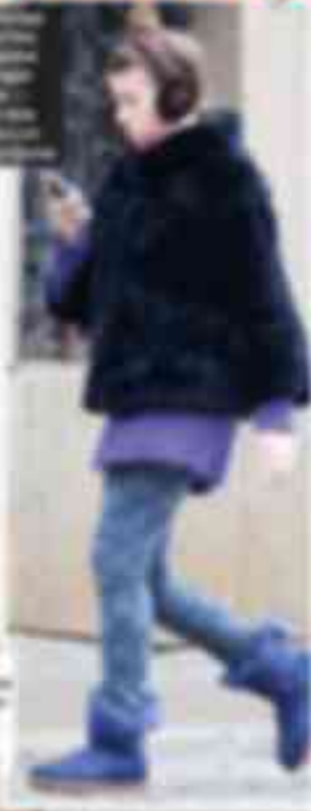
...иногда, когда в Риге — даже целый день.