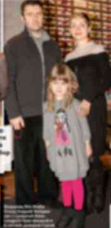
В воскресенье, 23 ноября, в кафе из ресторана Старый Рига состоялась Благотворительный бранч, целью которого стал сбор средств для детей, находящихся в реабилитационном центре.