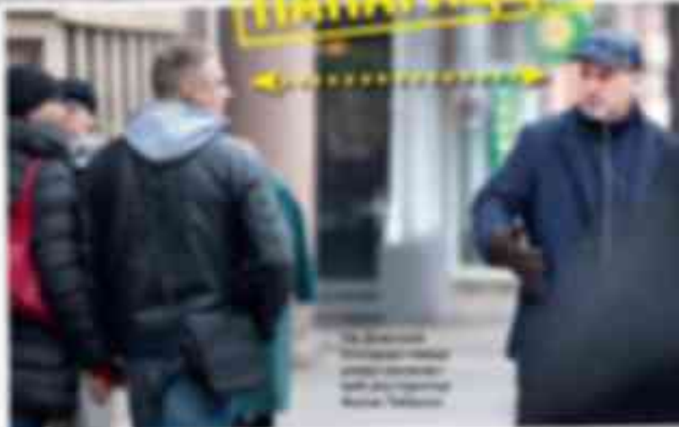
Валерий Меладзе гуляет с дочками по Старому городу.