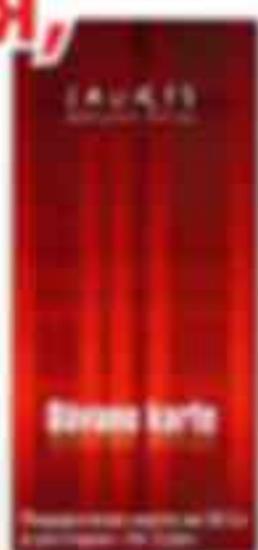
Возможные подарки в Dior