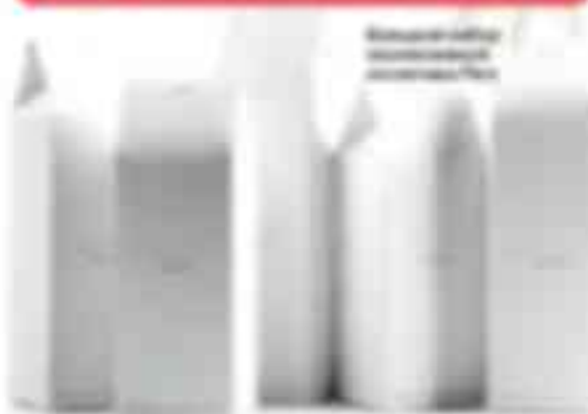
Возможные подарки в Dior