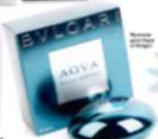
Возможные подарки в Bvlgari