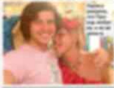
Шаляпин и его возлюбленная. Свадьба прошла в закрытом кругу. Шаляпин и его возлюбленная уже поженились. Свадьба прошла в закрытом кругу.