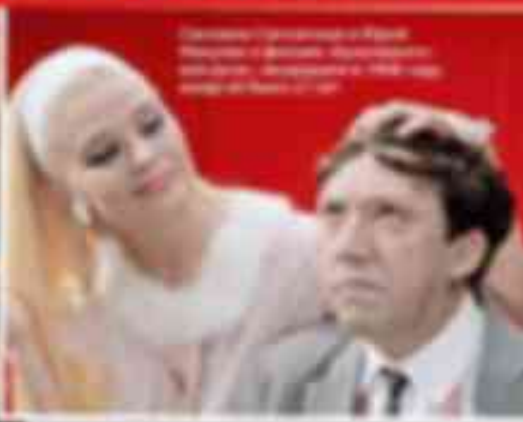
Светлана Светличная и Юрий Шатунов в фильме «Бриллиантовая рука». Слева: Светлана Светличная и Юрий Шатунов в фильме «Бриллиантовая рука».

Легендарная советская актриса Анна Сергеевна из культовой советской комедии «Бриллиантовая рука», Светлана Светличная (72), после долгого перерыва была рада вновь оказаться в Прибалтике.