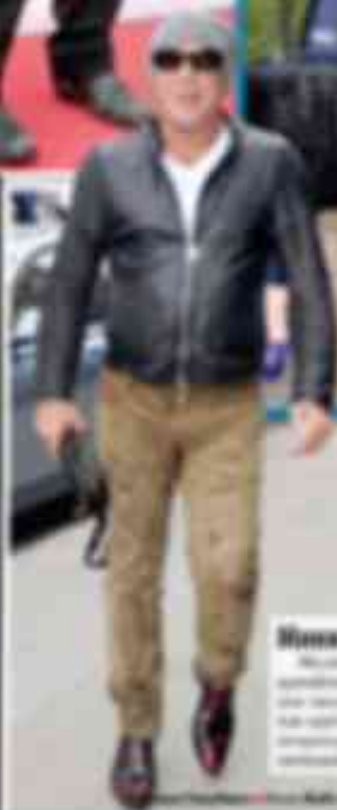
Милла Пюн (36)

Актер, режиссер, продюсер. В 2010 году основал студию «Медиа-Группа». В 2011 году основал телеканал «Медиа-Группа». В 2012 году основал телеканал «Медиа-Группа».