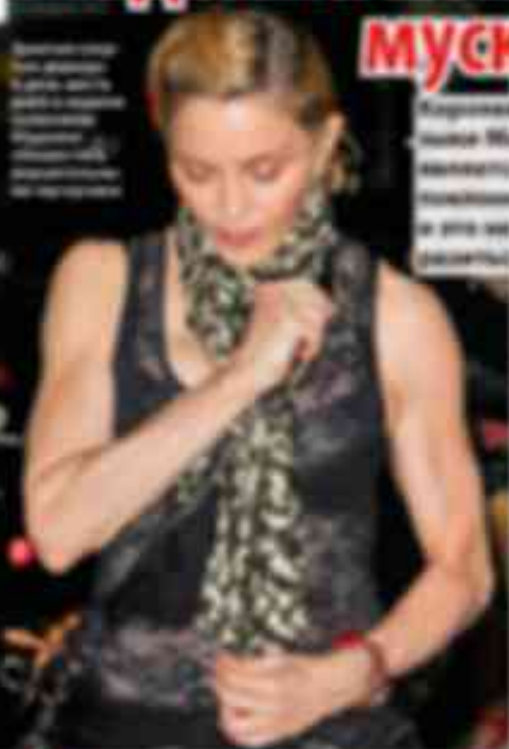
Курьезная фотография Мадонны (34) попала в известнейший американский журнал, и это не могло не отразиться на ее теле.