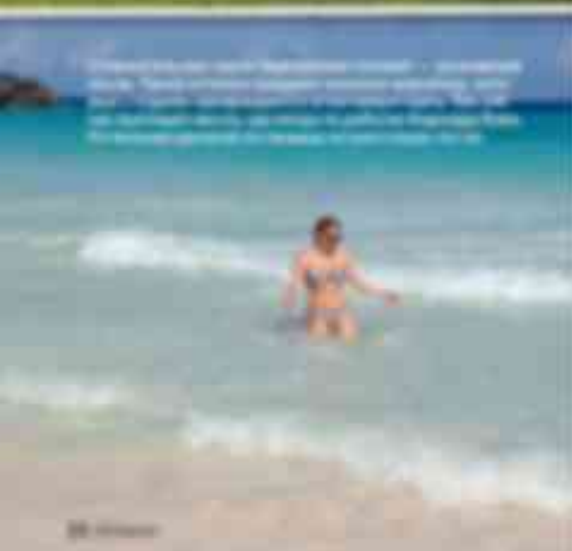
Здесь можно увидеть все, что угодно, и даже то, что вы никогда не видели раньше. В этом городе вы увидите все, что угодно, и даже то, что вы никогда не видели раньше.