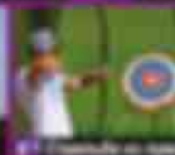
16 Полеты на параплане