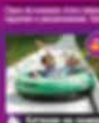
18 Катание на санях