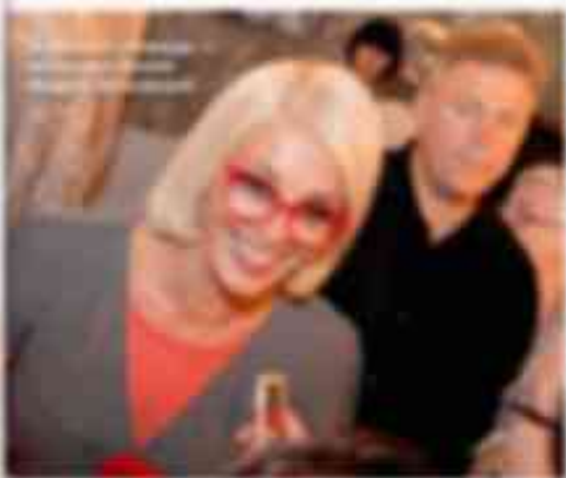
Лайма Вайкуле на открытии выставки

Васильев Александр Историк моды, автор книг и статей о моде. Он представит выставку «От войны в мир: Moda 1940-1950 годов». В экспозиции будут представлены модные тенденции того времени, а также работы известных дизайнеров. Выставка будет открыта в пятницу, 15 ноября, в 19:00. Вход свободный.