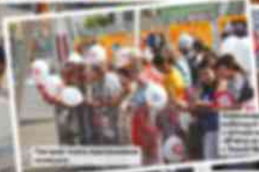
...del evento y la inauguración de la obra. El acto se desarrolló en un ambiente de gran cordialidad y se contó con la presencia de un gran número de espectadores que disfrutaron de la inauguración.