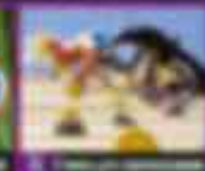
17 Полеты на воздушном змее