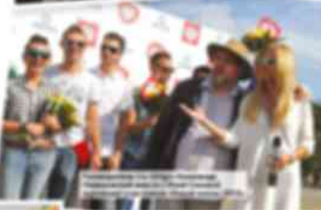
...del evento y la inauguración de la obra. El acto se desarrolló en un ambiente de gran cordialidad y se contó con la presencia de un gran número de espectadores que disfrutaron de la inauguración.