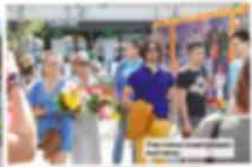
...del evento y la inauguración de la obra. El acto se desarrolló en un ambiente de gran cordialidad y se contó con la presencia de un gran número de espectadores que disfrutaron de la inauguración.