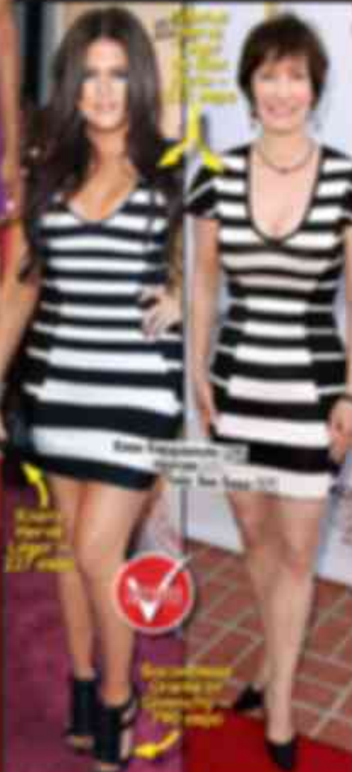
27 agosto 2012 (rosa) 28 agosto 2012 (rosa)

Il 7 agosto 2012, la cantante Beyoncé ha fatto il suo debutto sul palco con il suo nuovo album "I Am...Sasha Fierce". La cantante ha cantato "Single Ladies (Put a Ring on It)", "Destiny Fulfilled" e "I Am...Sasha Fierce".