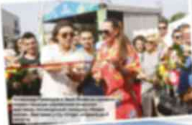
...del evento y la inauguración de la obra. El acto se desarrolló en un ambiente de gran cordialidad y se contó con la presencia de un gran número de espectadores que disfrutaron de la inauguración.

...entusiasmo y alegría en el momento de la inauguración. El evento contó con la presencia de autoridades locales, representantes de la comunidad y familiares de los deportistas. El acto se desarrolló en un ambiente de gran cordialidad y se contó con la presencia de un gran número de espectadores que disfrutaron de la inauguración. El evento se desarrolló en un ambiente de gran cordialidad y se contó con la presencia de un gran número de espectadores que disfrutaron de la inauguración.