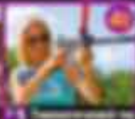
14 Полеты на воздушном шаре