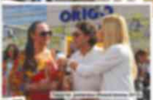
...del evento y la inauguración de la obra. El acto se desarrolló en un ambiente de gran cordialidad y se contó con la presencia de un gran número de espectadores que disfrutaron de la inauguración.