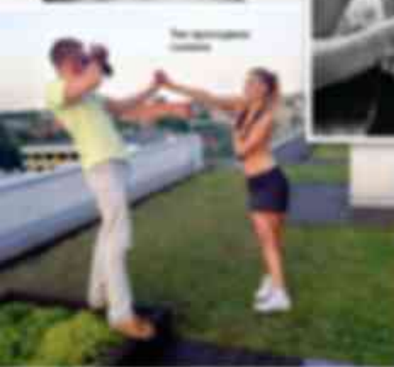
На тренировке в клубе