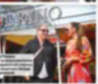
...del evento y la inauguración de la obra. El acto se desarrolló en un ambiente de gran cordialidad y se contó con la presencia de un gran número de espectadores que disfrutaron de la inauguración.