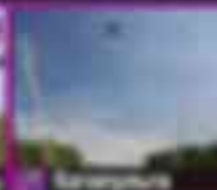
15 Катание на лыжах