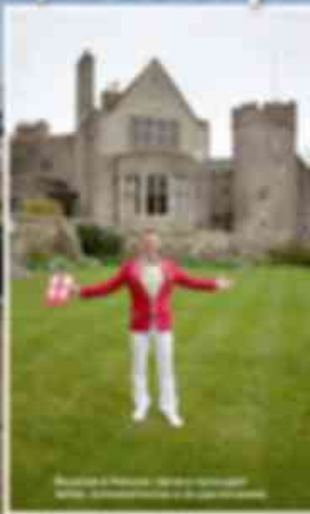
Модель в красной куртке и белых брюках перед английской резиденцией

Все чаще наши организаторы и ведущие мероприятий уезжают за границу, чтобы вести свадьбы, презентации, корпоративные вечера и другие тусовки. Почему это так востребовано? С какими нюансами они сталкиваются и как это работает с иностранцами?