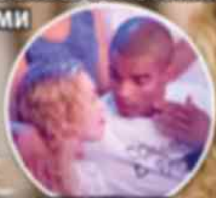
Мадонна и ее возлюбленный

Королева поп-му- зыки Ми- дленна Джанетти 18 августа отпразднует свои 55 ле- та, и, скорее всего, получит еще одну важную награду.