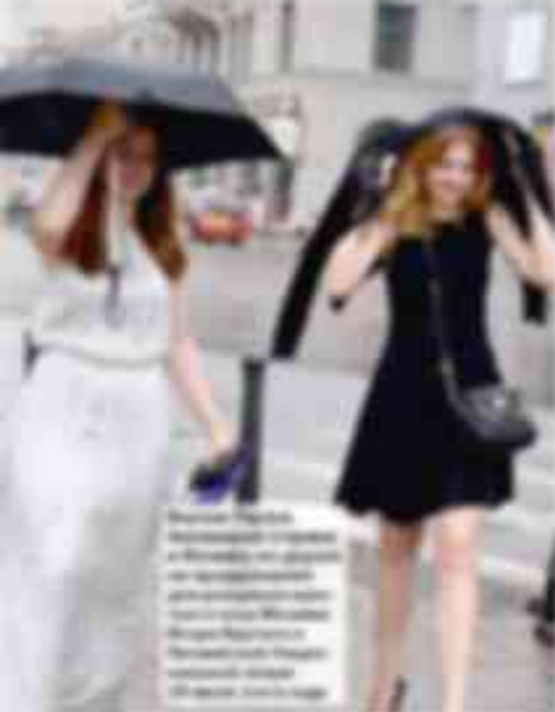
Вечерние прогулки по улицам Лондона и Парижа — это не только приятное времяпрепровождение, но и возможность сделать интересные снимки.

Лондон. Многие ошибочно полагают, что Лондон — это только金融中心, но на самом деле это город, который стоит посетить. — Сергей Савельев, Москва