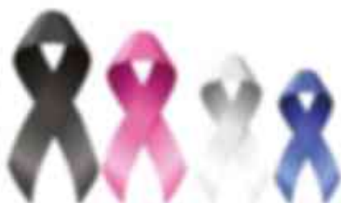
Эти ленты являются символами различных заболеваний, включая рак, ВИЧ, СПИД и другие.

В-одиннадцатых, в России существует высокая степень эмоциональности. Пациенты и родственники часто испытывают сильные эмоции, связанные с болезнью.