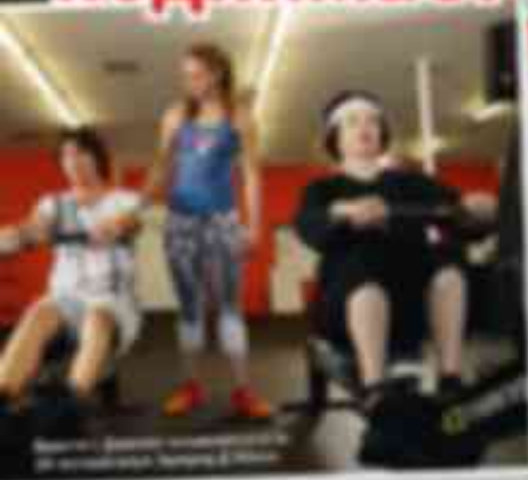
Видео: Джейк Шварцман/ABC © 2012 ABC

Надеемся вы писала, что мать Сильвестра Сталлоне Джанне (92), которую на свой более чем почтенный возраст, занимается танцами. Оказывается, она еще и весьма активна в спорте.