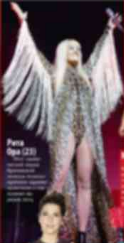
Pena Opa (23)

Modelo de vestido longo com detalhes brilhantes e asas brancas de penas.