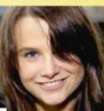
Они сделали карьеру до 30!