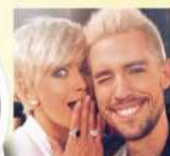
Риву поддержала Вера Брежнева