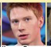
Никита Пресняков запутался в девушках