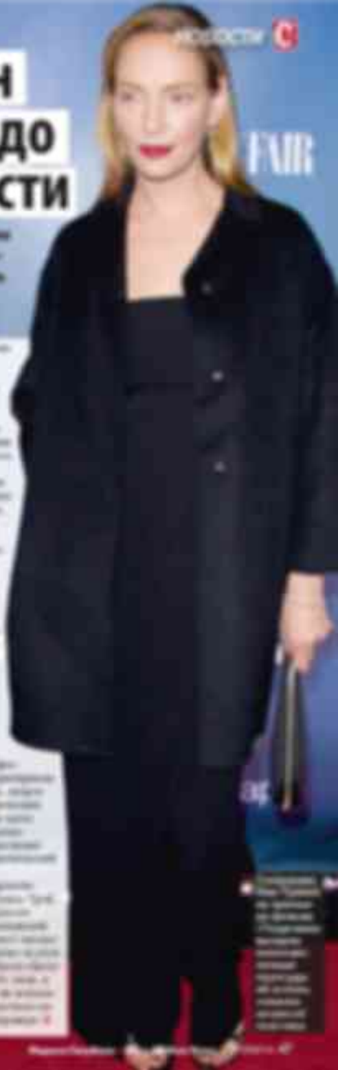
Ума Турман на красной дорожке.

М одные эксперты считают Уму Турман одной из самых стильных актрис современности. «Возвращение к истокам» — именно так можно охарактеризовать ее последние модные решения. Она предпочитает лаконичные и минималистичные образы, которые подчеркивают ее природную красоту. В последнее время она особенно часто выбирает темные оттенки, которые делают ее образ еще более загадочным и элегантным. Ума Турман — это пример того, как можно оставаться модной и актуальной, следуя своим внутренним предпочтениям и не боясь экспериментировать с цветом и формой. Ее стиль — это сочетание классики и современных тенденций, что делает ее образ по-настоящему уникальным и вдохновляющим.