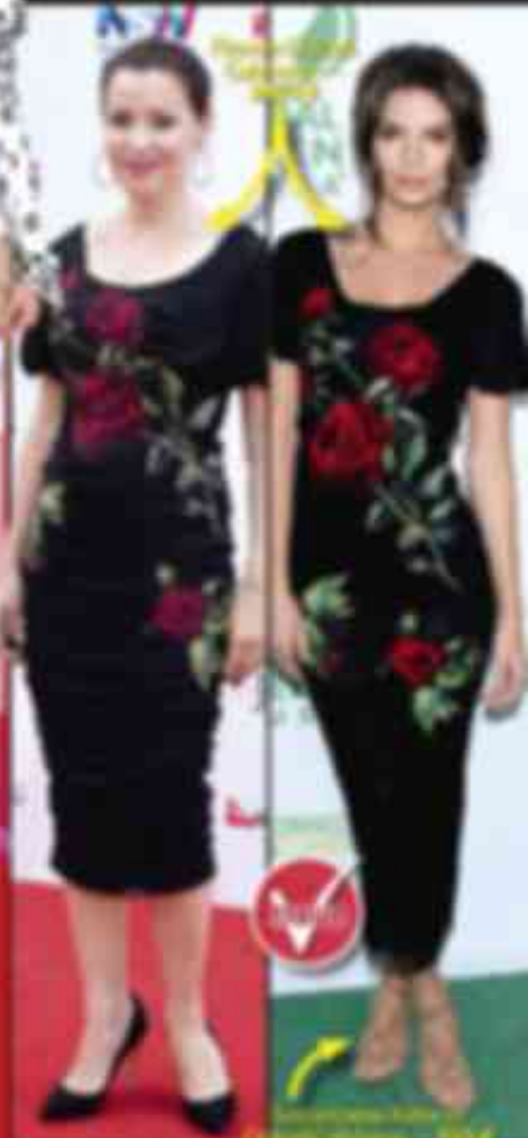
Длина юбки: 3/4 от роста. Юбка: 2/3 от роста.

Стиль и мода. Юбка. Длина юбки: 3/4 от роста. Юбка: 2/3 от роста. Юбка. Длина юбки: 3/4 от роста. Юбка: 2/3 от роста.