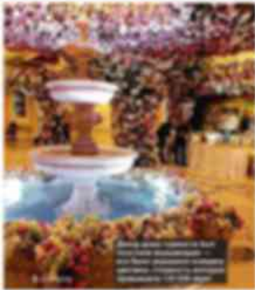
... танго, танго, танго... ... танго, танго, танго... ... танго, танго, танго...