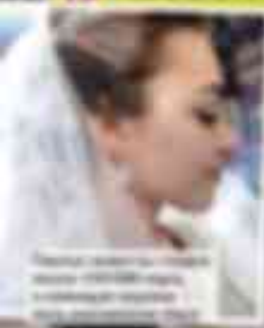
Последние кадры свадьбы пары, влюбившейся в юности