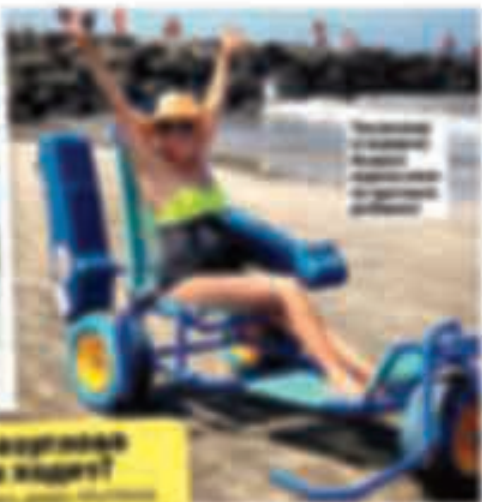
Вот как выглядит отдых в Европе: просто очень модно. В Европе отдыхать можно и просто так, и с комфортом, и с развлечениями, и с интересными занятиями.