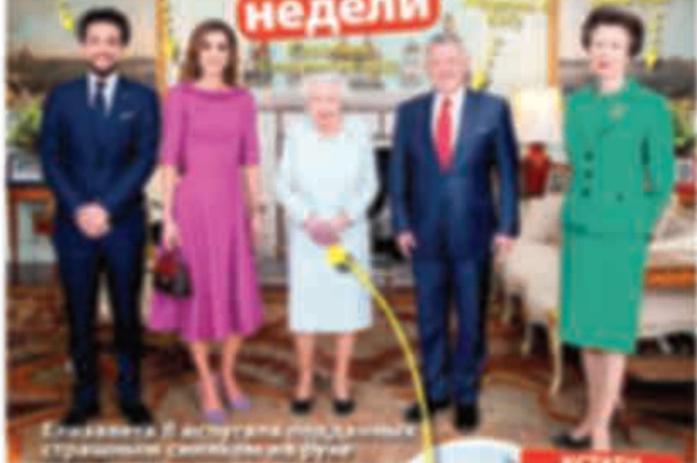
Елизавета II вручила рыцарские ордены своим друзьям

Елизавета II вручила рыцарские ордены своим друзьям. Среди награжденных оказались и российские граждане. В числе награжденных оказались и российские граждане. В числе награжденных оказались и российские граждане.