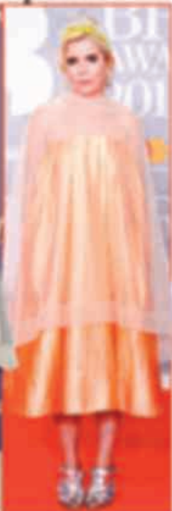
Гвенет Пэлтроу (слева) и Кейт Блинкленд (справа)