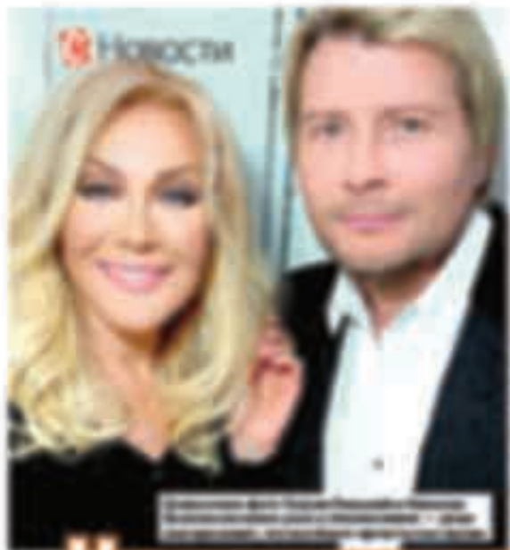
Светлана Савицкая и Александр Савицкий