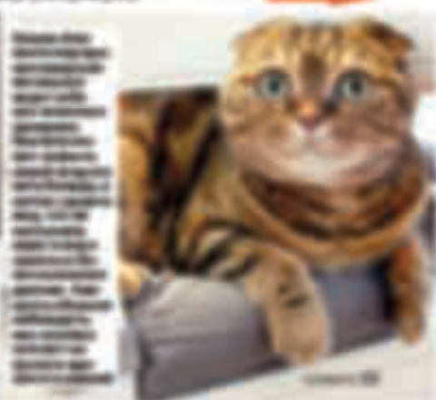
A ginger tabby cat lying down.