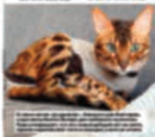
A ginger and white tabby cat lying down.

A woman practicing yoga in a room with large windows. A woman practicing yoga in a room with large windows. A woman practicing yoga in a room with large windows. A woman practicing yoga in a room with large windows.