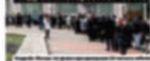
Похороны Андрея Жагарса в Санкт-Петербурге