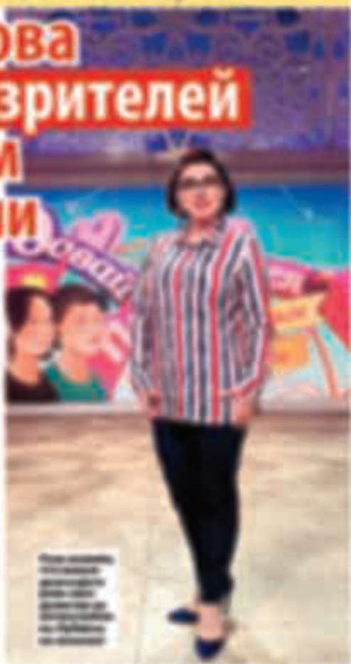
Роза Сябитова (37) вместе со своим коллегой ведет передачу «Роза и Андрей» («Домашнее кино»). Популярная Роза вместе с ней является успешным телеведущим, но ее друг Сябитова полностью отрицательна отношение к ней, что не является этой программы ей предлагается изменить место...