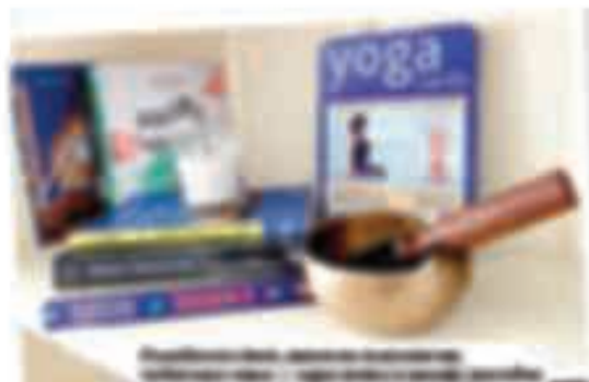
Essential oils are used in aromatherapy to help with stress and anxiety. Aromatherapy is a type of complementary therapy that uses essential oils to help with stress and anxiety.