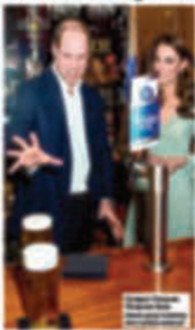
Герцогиня Катрин и принц Гарри за баром на вечеринке в честь дня рождения принца Гарри.

Впервые герцогиня Катрин появилась на публике в роли официантки. В сопровождении принца Гарри она работала за баром на вечеринке в честь дня рождения принца Гарри в Лондоне. Герцогиня Катрин была одета в светлую блузку и темные брюки. Она стояла за баром и налила пиво в стакан. Принц Гарри стоял рядом с ней, держа в руках бокал с пивом. Вечеринка была посвящена дню рождения принца Гарри, который исполнилось 34 года. На мероприятии присутствовали многие члены королевской семьи и гости. Герцогиня Катрин была замечена за баром, что стало редким для нее. Она выглядела очень комфортно и уверенно в своей роли официантки. Принц Гарри также был замечен за баром, что стало для него необычным. Вечеринка прошла в теплой и дружеской атмосфере. Герцогиня Катрин и принц Гарри провели время за баром, наслаждаясь пивом и общением с гостями. Это стало первым разом, когда герцогиня Катрин появилась на публике в роли официантки. Принц Гарри также был замечен за баром, что стало для него необычным. Вечеринка прошла в теплой и дружеской атмосфере.