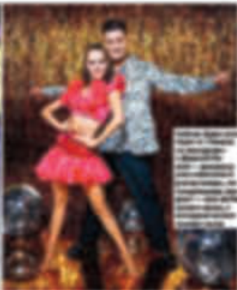
Муж и жена влюблены и счастливы.

...иногда бывает так, что вы чувствуете себя в безопасности, когда вы вместе. Это может быть связано с тем, что вы чувствуете себя в безопасности, когда вы вместе. Это может быть связано с тем, что вы чувствуете себя в безопасности, когда вы вместе.