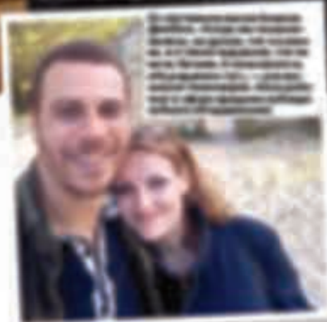
[Illegible text describing the couple in the photo above]