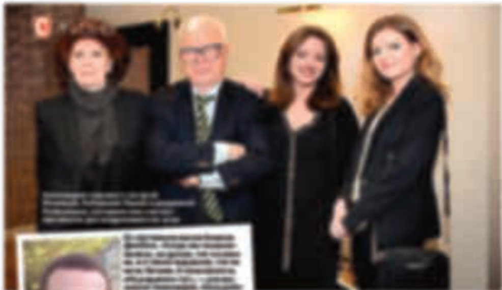
[Illegible text describing the group photo above]