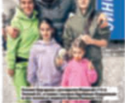
«Ксения Бородина и ее дети. Ксения Бородина — актриса, певица, телеведущая. Ксения Бородина — актриса, певица, телеведущая».