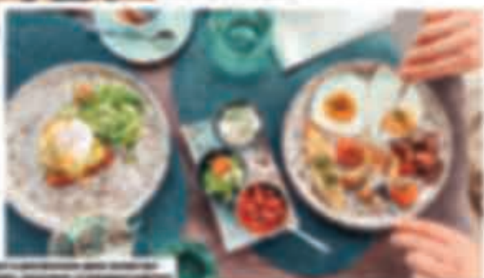
Þetta er einföld og ljúffkenleg uppskrift sem þú getur gert á 10 mínútum. Þú þarft aðeins smá hráefni og þú getur gert þetta á hvaða stigi sem er.

Þetta er einföld og ljúffkenleg uppskrift sem þú getur gert á 10 mínútum. Þú þarft aðeins smá hráefni og þú getur gert þetta á hvaða stigi sem er. Þetta er gott til að gefa börnum og eldri. Þú getur gert þetta á milli mála og þú getur gert þetta á milli mála. Þetta er gott til að gefa börnum og eldri. Þú getur gert þetta á milli mála og þú getur gert þetta á milli mála.