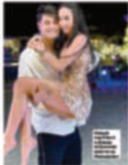
Муж и жена влюблены и счастливы