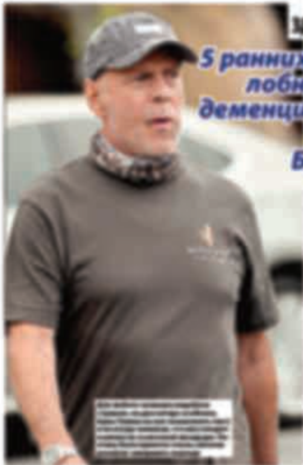
Брюс Уиллис страдает от лобно-височной деменции. Это заболевание характеризуется потерей памяти, изменением личности и поведением. Брюс Уиллис начал замечать изменения в своем поведении и памяти в возрасте 50 лет. В настоящее время он находится на стадии болезни Альцгеймера.

После того как стало известно о том, что страдает лобно-височной деменцией 57-летний Брюс Уиллис — американский актер, который уже не раз в свое время был в центре внимания СМИ и зрителей, появились сообщения о том, что Уиллис страдает от болезни Альцгеймера. Однако американский актер начал замечать первые признаки заболевания в возрасте 50 лет, когда ему было 47 лет.