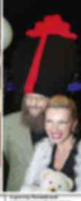
Il primo premio è stato consegnato a...