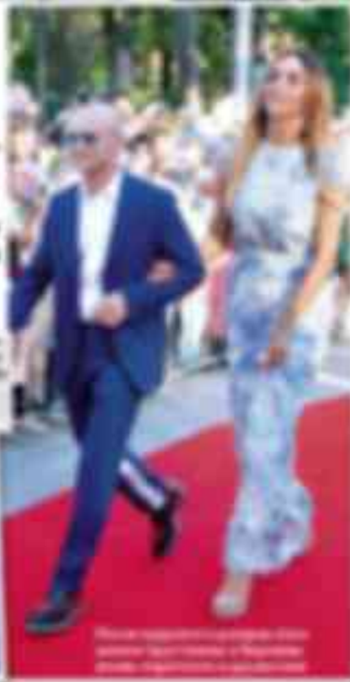
Екатерина Варнава и ее избранник на премьере фильма «Счастье — это»