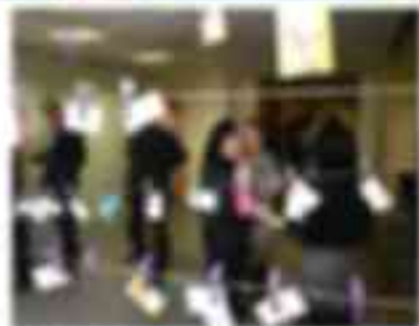
Участники конференции обмениваются опытом и задают вопросы экспертам.

«В этом году конференция посвящена актуальным вопросам продаж в различных отраслях экономики. В рамках мероприятия участники обсудят последние тенденции в сфере продаж и маркетинга, а также возможности для расширения бизнеса. Конференция пройдет в формате панельных дискуссий и презентаций. Участникам будет предоставлена возможность задать вопросы экспертам и обменяться опытом.»